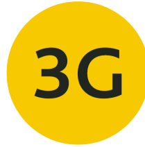
Geimpft, Ge- nesen, Getestet