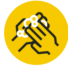
Bitte auf Hygiene achten

Alle Teilnehmenden 1 haben einen Impfnachweis gemäß § 22 a Abs. 1 IfSG, einen Genesenennachweis gemäß § 22 a Abs. 2 IfSG oder einen Nachweis über eine negative Testung gemäß § 7 vorzulegen. § 8 Abs. 4 Sätze 2 und 3 gilt entsprechend.